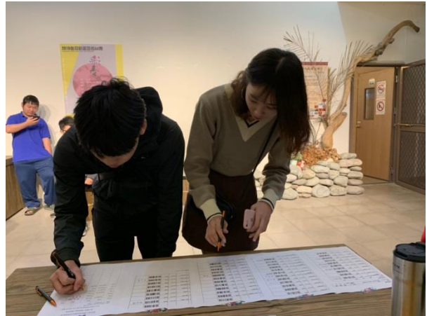
說明：同學簽到情形