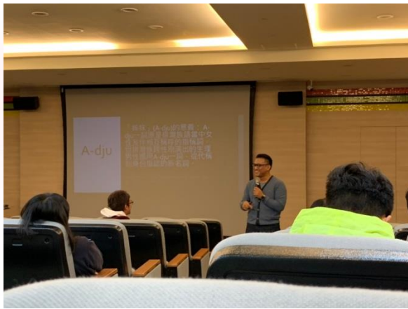
說明：講師與同學互動情形