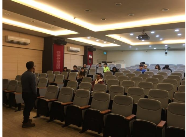
說明：同學聽講情形