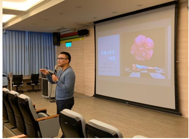
說明：講師講解情形