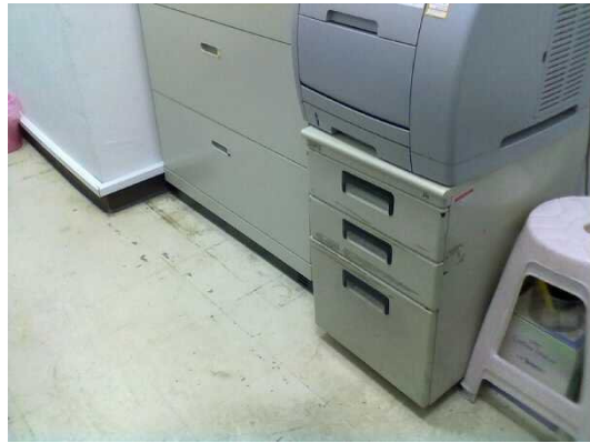
圖 7 辦公書櫃應隨時歸位以策安全