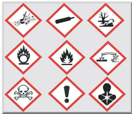
圖 4 〈System, GHS〉所訂定之 化學品危害圖示