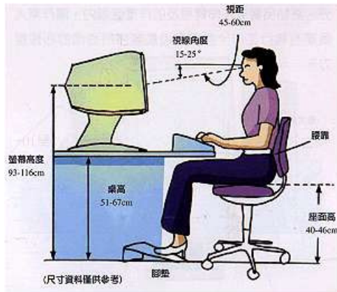
圖 6 電腦作業應注意坐姿及休息