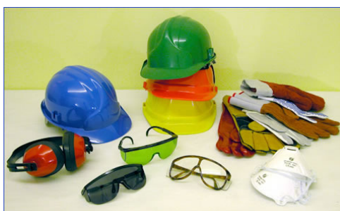
圖 9 個人安全防護具是保護個人安全的最後一道防線，務必依規定配戴