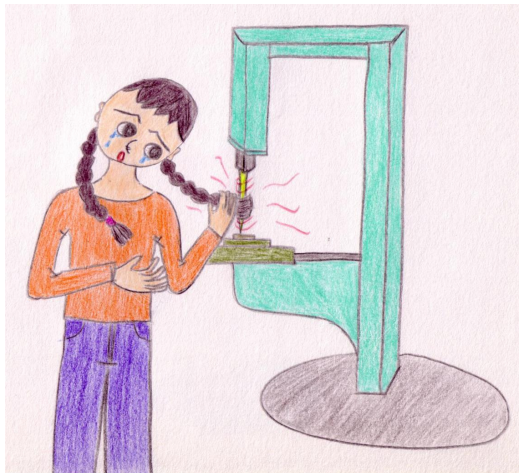
圖 8 長髮及寬鬆衣物等容易被機械纏繞而造成人員受傷