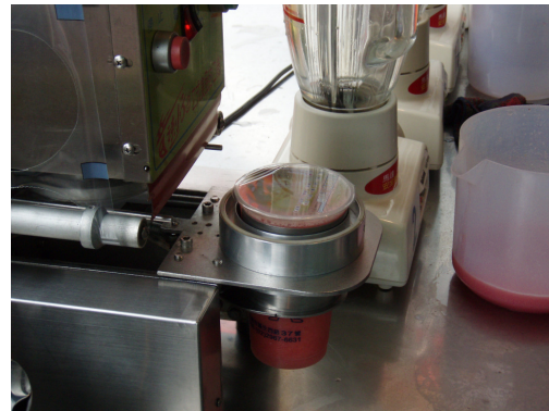
圖 1 使用封口機應注意安全防護