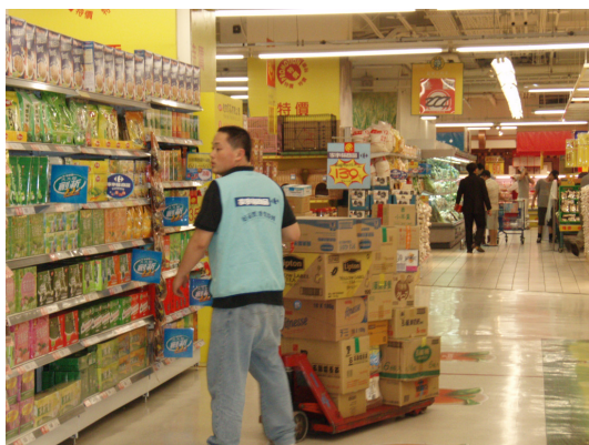
圖 2 賣場工讀應注意搬運物料之重量是否能負荷